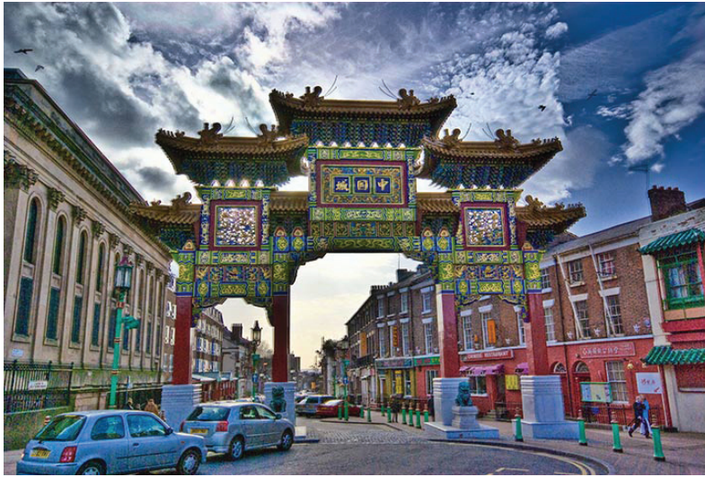
▶ ഗേറ്റിന്റെ കാര്യത്തിൽ ചൈന നമ്മുടെ ഒരു സഹോദര സ്ഥാപനമാണ്. മതിലുകളും ഗേറ്റുകളും അവർക്ക് ഒരു തരം നൊസ്റ്റാൽ.

സാമ്പത്തിക പരാധീനതയുള്ള ഒരിടത്തരം സർക്കാർ സ്ഥാപനമാണെങ്കിൽ ഗേറ്റ് ഒരു കോടിയുടെ എസ്റ്റിമേറ്റിൽ കുറയരുത് എന്നാണ് സാമൂഹ്യ ഗേറ്റ് പരിഭാഷപ്പെടുത്തിയ ചൈനീസ് പുരാണഗ്രന്ഥത്തിൽ പറയുന്നത്. ധനാധ്യതയുടെയും ധൂർത്തിന്റെയും പര്യായമായി ഒരു ഗേറ്റ് മുറ്റത്തുണ്ടെന്ന് നിലക്കുമ്പോൾ എല്ലാ ദാരിദ്ര്യവും പോയി മരയും എന്ന് പ്രത്യേകം പറയേണ്ടതില്ലല്ലോ. ഇത്തരം ഒരു ഗേറ്റിന്റെ നിർമ്മാണം തുടങ്ങുമ്പോൾ തന്നെ പലരുടെയും സാമ്പത്തിക മാന്യം മാറുന്നതായി കാണാം.